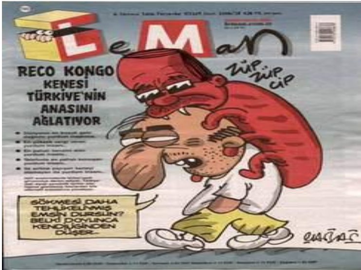
4- Reco Kongo Karikatürü