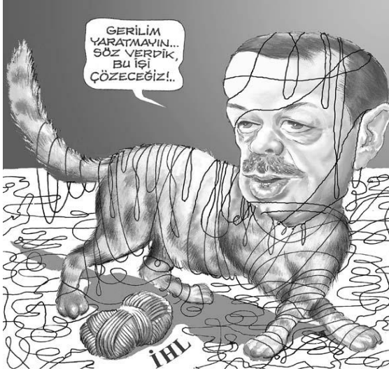
2- Kedi Karikatürü