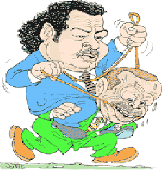
1- Gölgedekiler Karikatürü

başka boyutuyla da AIHM'ye bu çerçevede yapılan başvurular sonucu Türkiye Cumhuriyeti Devleti'nin tazminat yaptırımı ile karşı karşıya kalması kaçınılmaz olacaktır.