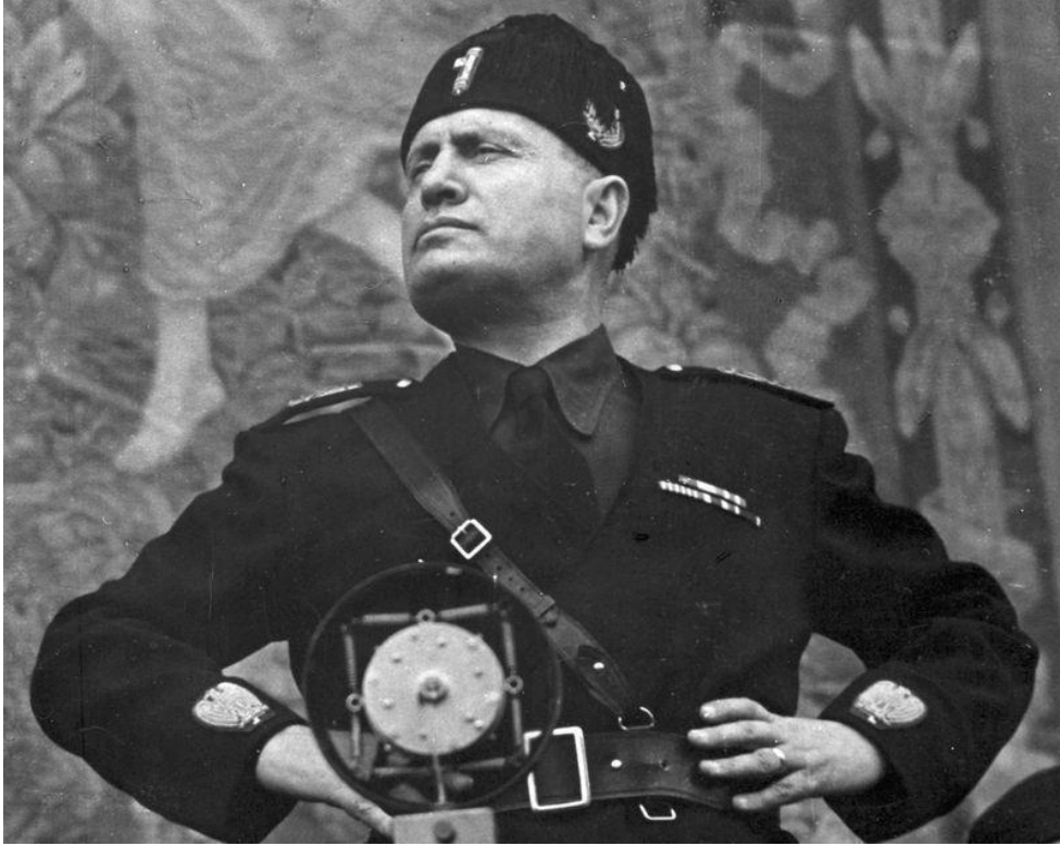
Mussolini'nin Balkon Konuşması

Yıllar içerisinde Makyavel ve faşizmi ortak gösteren birçok çalışma yapılmıştır. Bunların muhtemelen en önemli öncülü Giacomo Matteotti'dir. Matteotti, faşistler tarafından katledilmeden önce Makyavel ile Mussolini arasında bağlantı kuran bir yazı yazmıştır: Makyavel, Mussolini ve Faşizm . Matteotti'ye göre Mussolini, Makyavel'in otorite ve güç kavramlarını kendi lehine manipüle etmiş ve böylelikle güç üzerine kurulmuş bir devlet modeli inşa etmiş, devlet eliyle yönetilen illegal uygulamaları legal kılan bir politika gütmüştür (Mitarotondo, 2016, s.7).