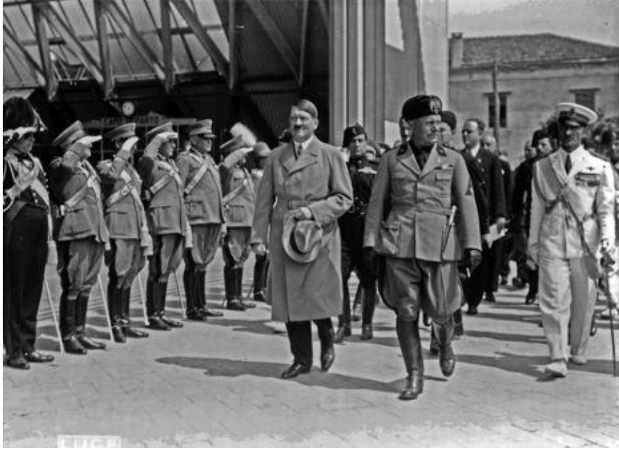
Hitler Venedik Ziyaretinde

1939'da Almanlar Çekoslovakya'ya girdiğinde Mussolini savaşa girmek istememiştir. Çünkü henüz yeterli silahlanmaya sahip değildir. Hükümetin ve ordunun büyük çoğunluğu ayrıca Papalık, Almanya karşıtı olsa da Mussolini bütün muhalefete rağmen halkını savaşa sokar. Yıllarca süren savaş Almanların dolayısıyla da İtalyanların yenilgisiyle sonuçlanır. Mussolini kralın emriyle tutuklanır. Bu bir devrin kapanışı anlamına gelmektedir: Faşizm sona ermiştir.