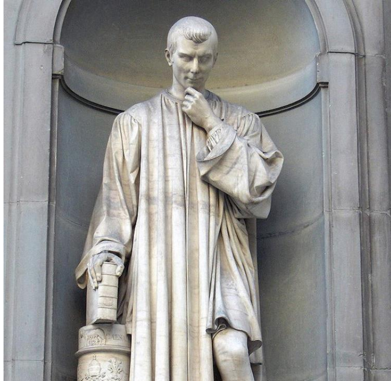
Floransa'daki Makyavel Heykeli